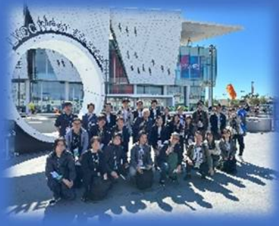
NAB SHOW2024 ツアーより